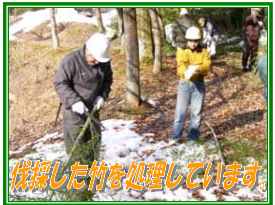
伐採した竹を処理しています。