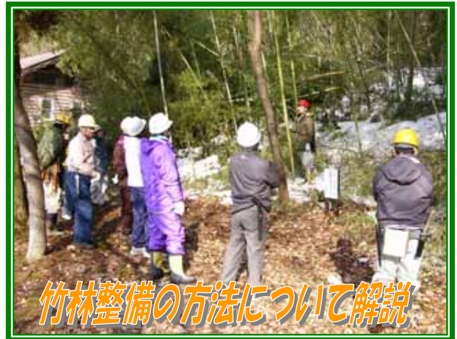
竹林整備の方法について解説

とはいうものの、活動をするにあたっては、何れともあれ「 安全管理 」が最重要課題です。どんなに有意義な活動であっても、楽しい活動であっても、その活動をする中で、怪我人が出るようではどうしようもありません。そこで、今回の「先生方との体験会」では、里山整備活動における安全管理を中心に実施しました。